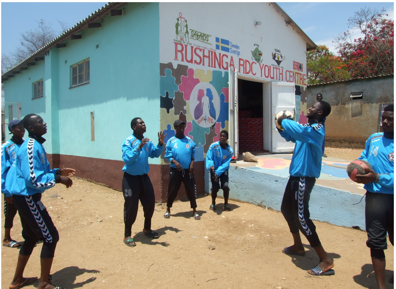
Farmers' Club – Rushinga Youth Center