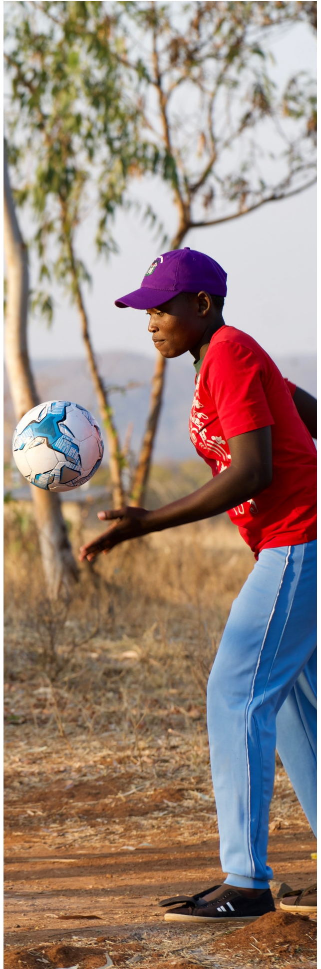
Ponesai Vanhu Technical College