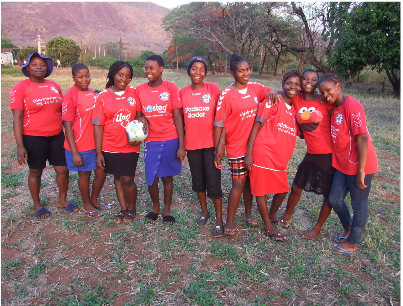
Ponesai Vanhu Junior School & Farmers' Club - Park Estate