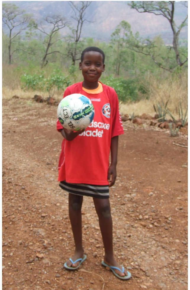
Farmers' Club - Park Estate